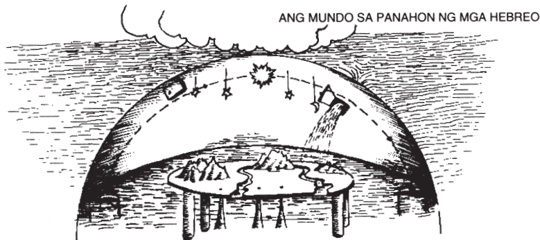
Kailaliman (o Sheel, o Impiyerno)

Sa pananaw ng mga tao noong unang panahon, parang mesang bilog ang mundo at may mga haligi itong nakatukod sa ilalim ng dagat. Nasa pinakamataas na bahagi ang Langit ng mga Langit, o ang Kataas-taasang Kalangitan , ang tahanan ng Diyos. Nakabitin sa kulangong na tinatawag na kisame ang araw, buwan at mga bituin. Nanggagaling ang ulan sa mga tubig sa itaas , sa ibabaw ng kisame. Nasa ilalim ng lupa naman ang pook ng mga patay, o impiyerno , at ikinakabit ito sa ating mundo ng libu-libong butas – ang mga libingan ng mga patay.